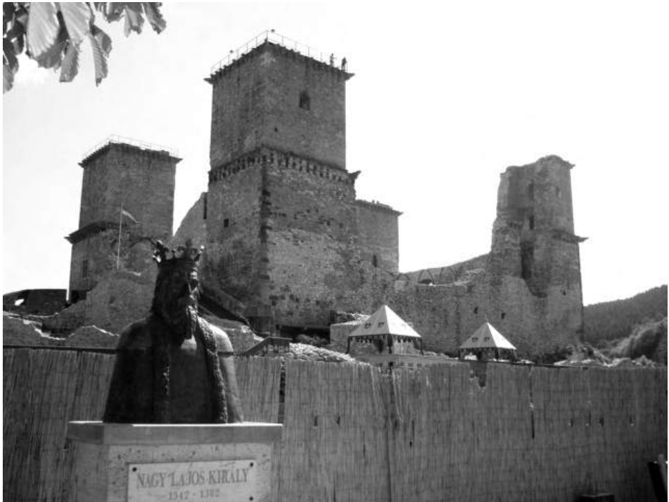
Fot. 1. Popiersie Ludwika Węgierskiego (Wielkiego) przed jego zamkiem Diósgyőr w Miskolcu (węg. Miskolc ) w komitacie Borsod-Abaúj-Zemplén w północno-wschodniej części obecnych Węgier.

Pomyłkę Długosza co do roku urodzenia Jadwigi dopiero po ponad czterech stuleciach wykrył Jan Dąbrowski. Analizując dokumenty źródłowe związane