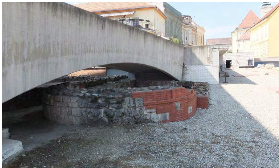
Fot. 9-10. Székesfehérvár – częściowo zrekonstruowane pozostałości katedry królewskiej.