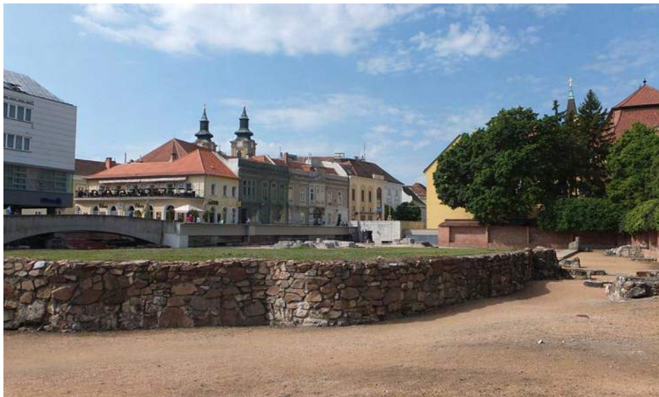
Fot. 7-8. Tzw. Ogród Ruin (węg. Középkori Romkert ), czyli pozostałości Katedry Panny Marii w Białogrodzie Królewskim (węg. Székesfehérvár ), kościoła koronacyjnego i nekropolii władców węgierskich m.in. Ludwika Węgierskiego i Elżbiety Bośniaczki. Romańska świątynia z początku XI w., wielokrotnie przebudowywana, uległa całkowitemu zniszczeniu podczas eksplozji prochu w 1601 r., niszcząc nie sprofanowane jeszcze przez Turków pochówki monarsze.