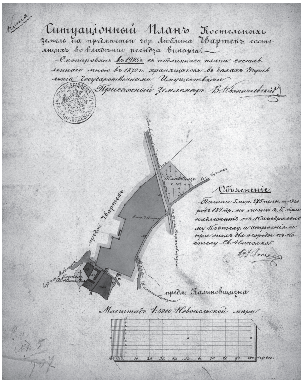
Fot. 2. Kopia fragmentu poprzedniego planu, wykonana w 1905 r. (Archiwum Państwowe w Lublinie, zesp. 22, sygn. 153).